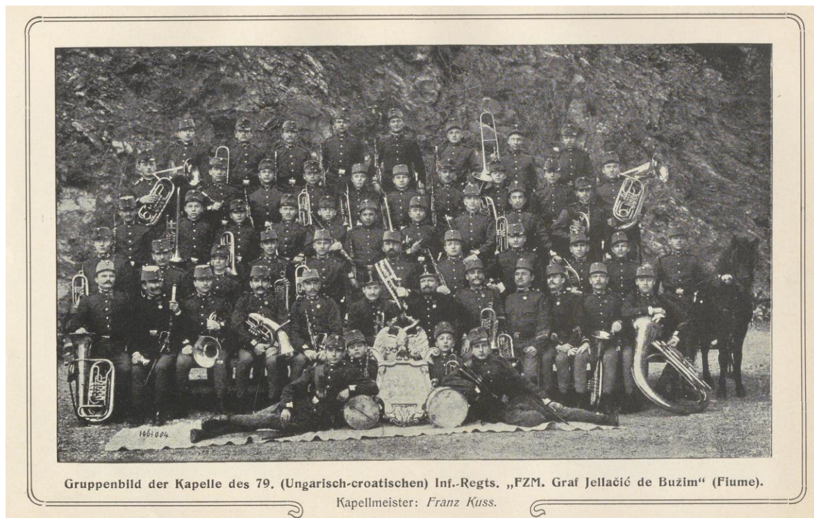
Orchestra of Ban Jelačić infantry regiment