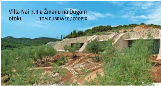
Villa Nai 3.3 u Žmanu na Dugom otoku