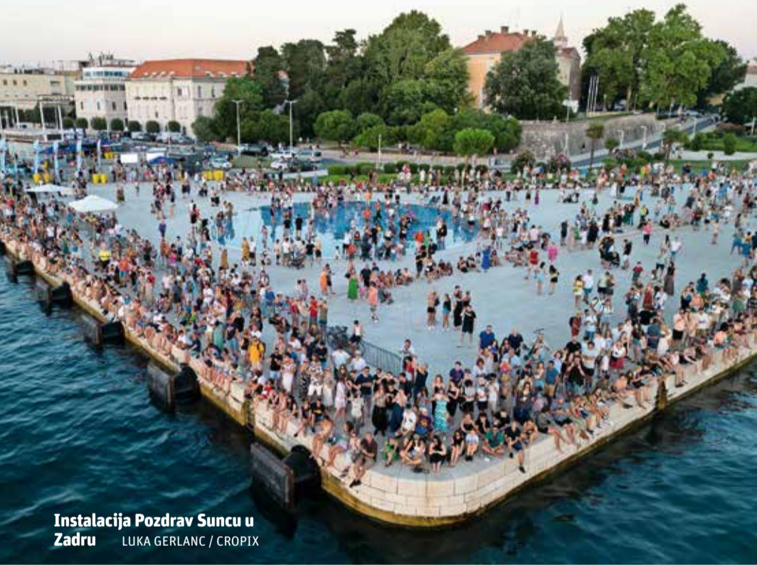
Instalacija Pozdrav Suncu u Zadru

noj kompleksnosti građenja, arhitekti više ne mogu ostvariti integritet kreativnog procesa. Vođenje značajnih projekata preuzeo je pravni, ekonomski i inženjerski menadžment, a arhitektonsko umijeće podređeno je merkantilnom dizajnu. U takvoj preraspodjeli uloga arhitekti ne mogu dosegnuti socijalno-progresivni i angažirani doprinos društvu kakav su postizali u herojskom vremenu moderne. Tada je arhitektura oblikovala vrijeme, današnjem vremenu ona samo služi. Moć nad prostorom preselila se u politički zabran, a kreativna arhitektura sterilizirana je birokratskim i planerskim luđačkim košuljama.