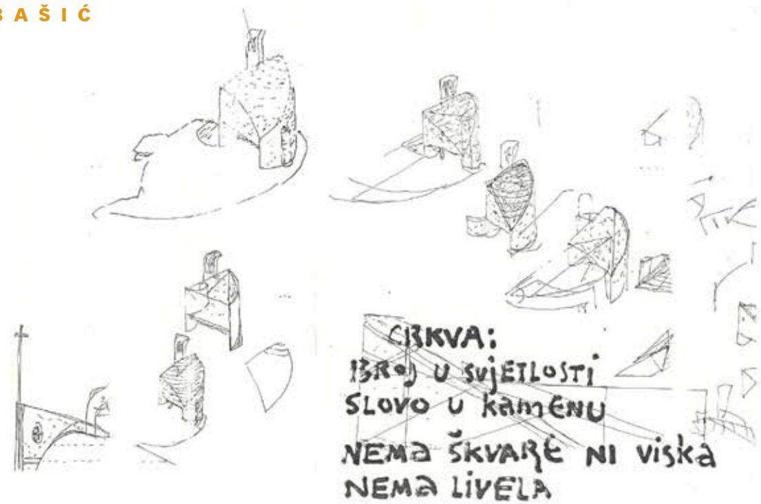
Skica za projekt crkve Gospe od Karmela, Okit, Vodice

ka, ugostitelja, OPG-ovca, a ne samo za moćne kompanije. Zašto se moraju toliko mučiti u Kornatima ili Žutu da dobiju legalan vez pred kućom ili restoranom? Zar ne bi bilo bolje da je umjesto ACI-jeve marine na Panituli, s tim novcima, u tipologiji tradicijskog porta, u NP KORNATI napravljeno dva-desetak nautičkih gnjezdašća. Tako dolaziš kod autentičnog kornatskog domaćina, na njegov obiteljski posjed, dolaziš kod čovjeka koji je time postao subjekt zaštite, izvaninstitucionalni ali autentični rendžer . Uostalom, to je jedini zakoniti način pružanja usluga posjetiteljima u nacionalnim parkovima u kojima nije dopuštena profitna djelatnost trgovačkih društava, odnosno, ako takva postoji, onda se sav profit ostvaren u prometu s posjetiteljima mora vratiti u zaštitu prostora.