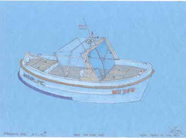
Skica Malog remorkera, otočnog obalnog vozila

dvije grede od šest metara ili skale za čupanje maslina, a da ti ništa ne ometa sigurnu plovidbu. Nazvao sam ga Mare . Kratica za Mali remorker. A ideja je bila individualiziranje otočkog prometa. Kako bi bilo da na kopnu nema osobnih automobila i da se možete voziti samo vlakom, autobusom i avionom? Zašto na moru ne postoji osobno plovilo? Zašto naš brodski registar ne prepoznaje tu vrstu broda? Moja gajeta kojom dolazim do mog otopnog posjeda i gliser nekog Švabe od 6 metara koji vuče skije, pred zakonom su potpuno isti. Država ne prizna da moram doći do svoje kuće i svojeg posjeda brodom koji je moje osobno plovilo i nije ni gospodarsko niti rekreacijsko. I kad odavde idem u Biograd kod doktora ili u provišt, kao što sam išao bezbroj puta, nemam šanse naći nužni pristan. Na području grada Zadra ne postoji ni jedan vez gdje bi čovjek iz Preka, koji je na prepisaj od grada, imao sigurno pristanište. Zato on uvijek u Zadar mora ići trajektom. To se događa kad ne razumijemo vlastiti prostor.