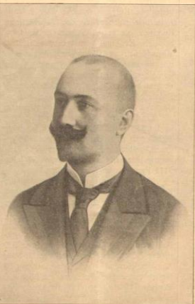
Prinz Konrad Hohenlohe k. k. Statthalter, Ehrenbürger von Volosca-Abbazia.

Freudig vernahm die Bevölkerung diese Kundgebung unserer Gemeinde-Vertretung, diese Auszeichnung gilt ja einem Manne, welcher auf einem schwierigen Posten Hervorragendes leistet, welcher in aufopfernder Arbeit stets fürsorglich auf das Wohl des Landes, der Gemeinden und der Interessen Aller bedacht ist. Es ist ja allgemein bekannt, dass Se. Durchlaucht, der hochgeborene Prinz, Jedem zu helfen bereit ist, wenn es nur halbwegs möglich ist, Jedermann kommt er freundlich und leutselig entgegen, sei es, wenn der Ortsvorsteher im Gemeindefreunde, der Gewerbetreibende, der Landmann oder der Arbeiter in irgend einer Angelegenheit sich an ihn wendet.