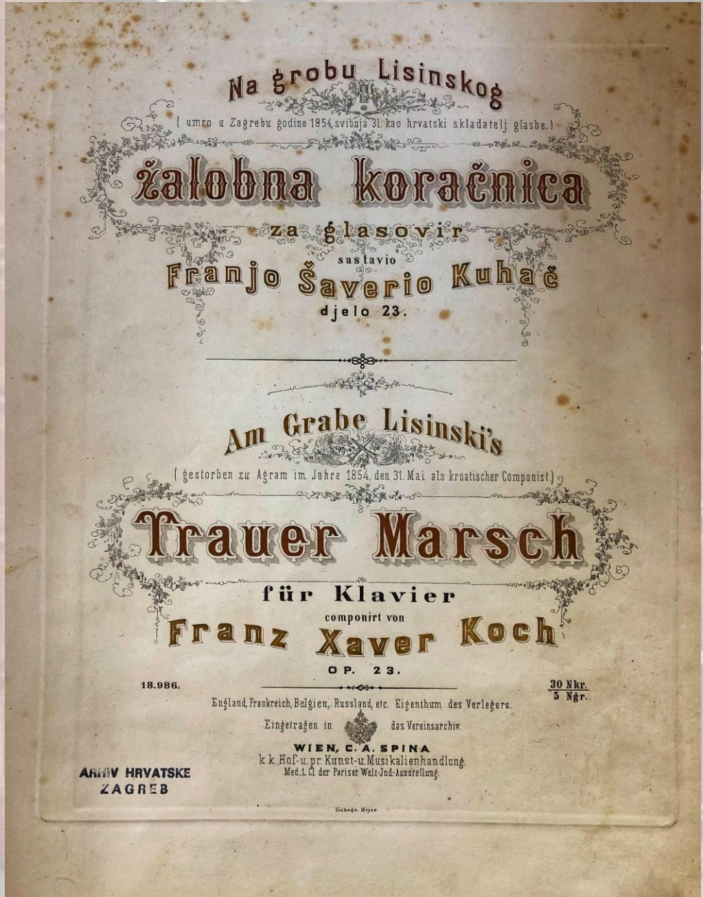
On Lisinski's grave, Trauermarsch, Op. 23 (1866)

CANDIDE — OLTAIRE — 759 — THOMAS ARLYLE'S COPY