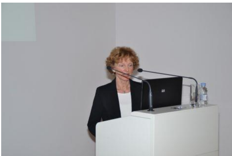
Prof Božena Šarčević predavala je o apoptozi u karcinomima dojke