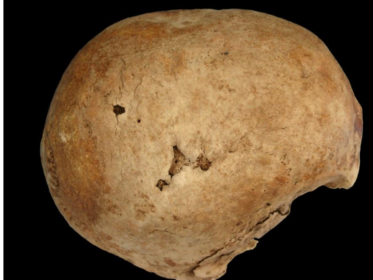
Slika 21. Litički defekti na glavi kod muškarca 35-40 godina iz groba 128 (osoba B).