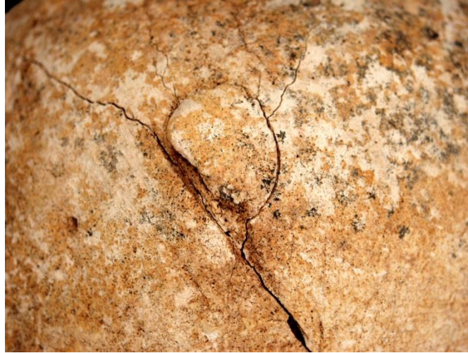
Slika 24. Antemortalna posjekotina na desnoj tjemenoj kosti - detalj.