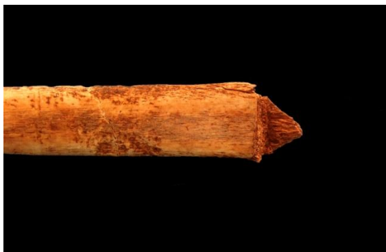
Slika 17. Životinjsko rebro odsječeno oštrim predmetom nađeno u grobu 109.

Asocirani materijalni ostaci ili životinjske kosti: fragment životinjskog rebra kojemu su oba kraja odsječena oštrim predmetom a na dijafizi s inferiorne strane vidljiva su dva plitka reza (slika 17).