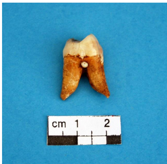
Slika 27. Dentin pearl na drugom kutnjaku gornje čeljusti.