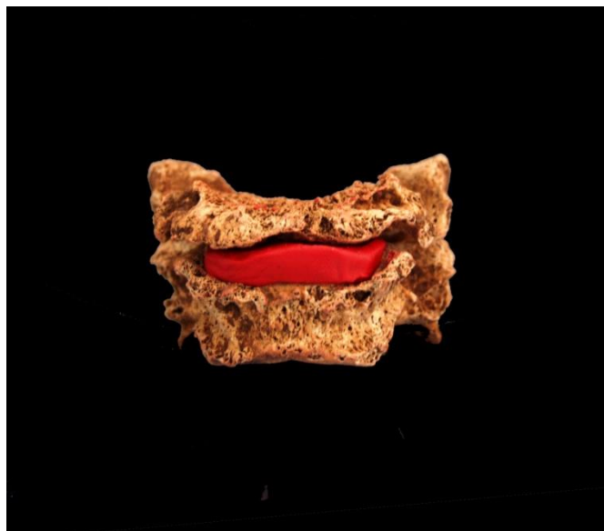
Slika 22. Moguća fraktura 6. vratnog kralješka kod žene 40-45 godina iz groba 136 (osoba B).