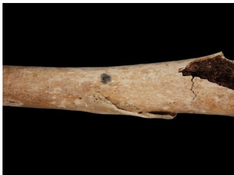
Slika 29. Loše zarasla fraktura - detalj.