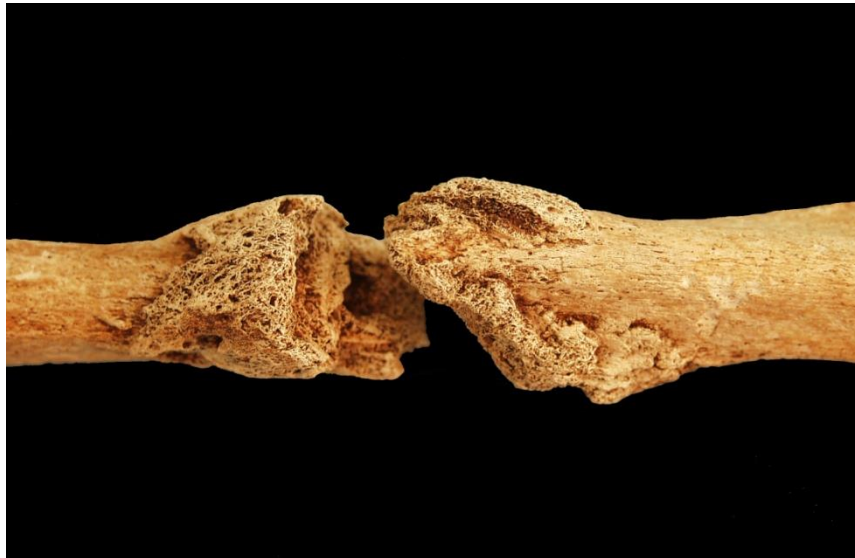
Slika 19. Fraktura lijeve nadlaktične kosti kod muškarca 40-45 godina iz groba 114 (osoba C).

Asocirani materijalni ostaci ili životinjske kosti: nisu prisutni u ušćuванom uzorku.