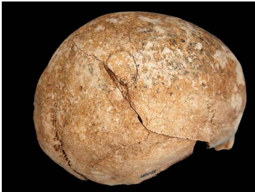
Slika 23. Antemortalna posjekotina na desnoj tjemenoj kosti kod muškarca iz groba 154 (osoba A).

Asocirani materijalni ostaci ili životinjske kosti: nisu prisutni u ušćivanom uzorku.