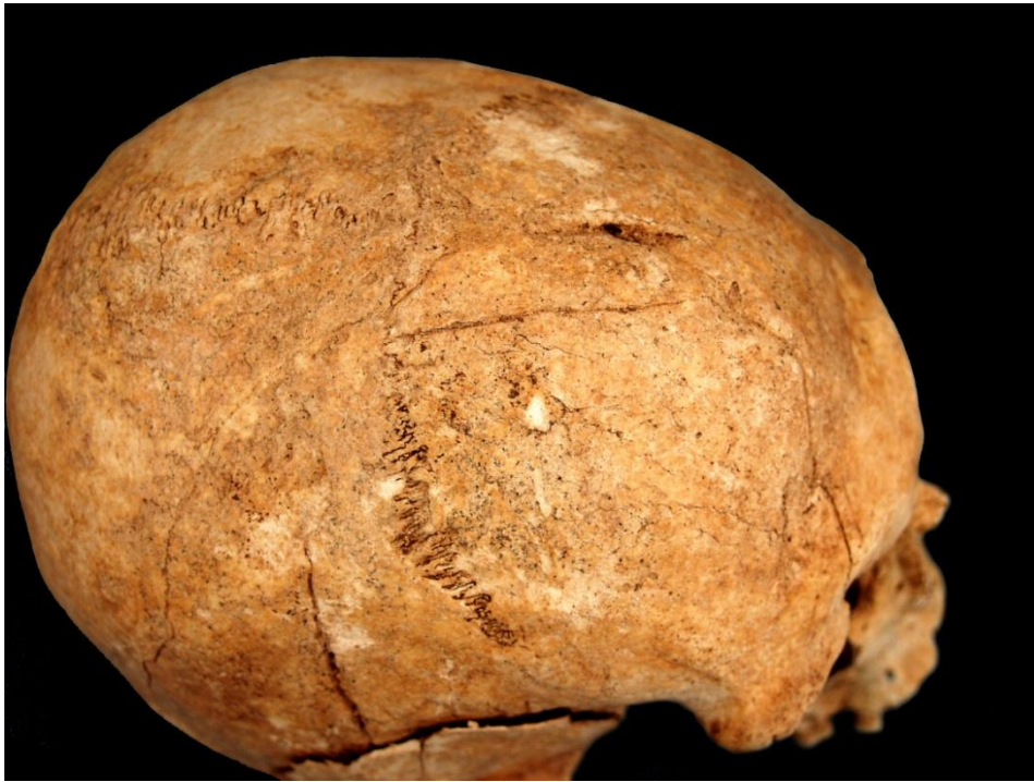
Slika 18. Antemortalna depresijska fraktura na desnoj tjemenoj kosti kod muškarca 40-45 godina starosti iz groba 113 (osoba A).

Asocirani materijalni ostaci ili životinjske kosti: nisu prisutni u uščuvanom uzorku.