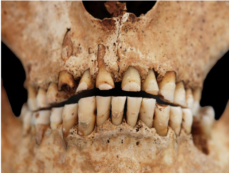
Slika 16. Vrlo jaka abrazija anteriornih zubi kod muškarca 40-45 godina iz groba 101 (osoba A).

Asocirani materijalni ostaci ili životinjske kosti: nisu prisutni u ušćuванom uzorku.