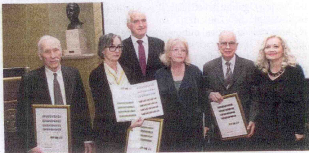
● Predstavljene su marke posvećene Strossmayeru, Supeku i Sorkočeviću

Podsjetio je, među ostalim, na zasluge biskupa Josipa Jurja Strossmayera koji je u Zagrebu utemeljio Akademiju , moderno Sveučilište i Strossmayerovu galeriju starih majstora te izgradio katedralu u Đakovu, čime je znatno pridonio uključenju Hrvatske u zapadnu europsku civilizaciju. »Zahvaljujući Strossmayeru Zagreb se potvrdio i kao kulturna, a ne samo politička metropola i time postao ravan drugim europskim metropolama«, rekao je akademik Kusić , poručivši da je i danas aktualna Strossmayerova misao da se samo znanošću Hrvatska može pozicionirati u svijetu, a kulturom i umjetnošću očuvati svoj identitet - priopćeno je iz HAZU-a. ■